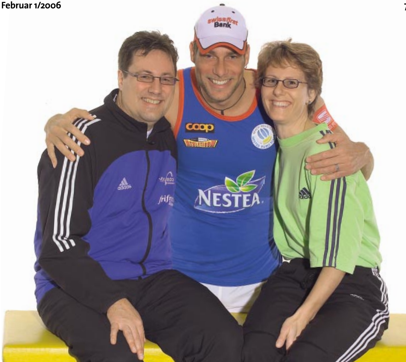
Das Schweizer Volleyball braucht beide – die «Sascha Heyers» und die «Regulas und Ruedis»

darum auch ein ganz klein wenig mir gehört.