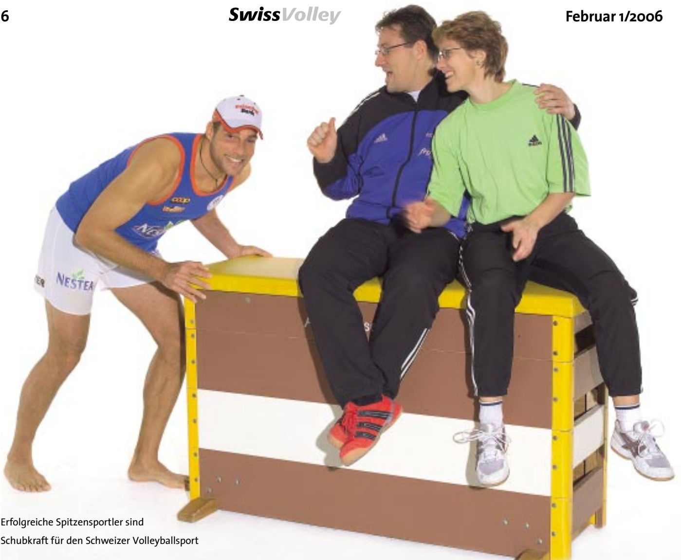
Erfolgreiche Spitzensportler sind Schubkraft für den Schweizer Volleyballsport